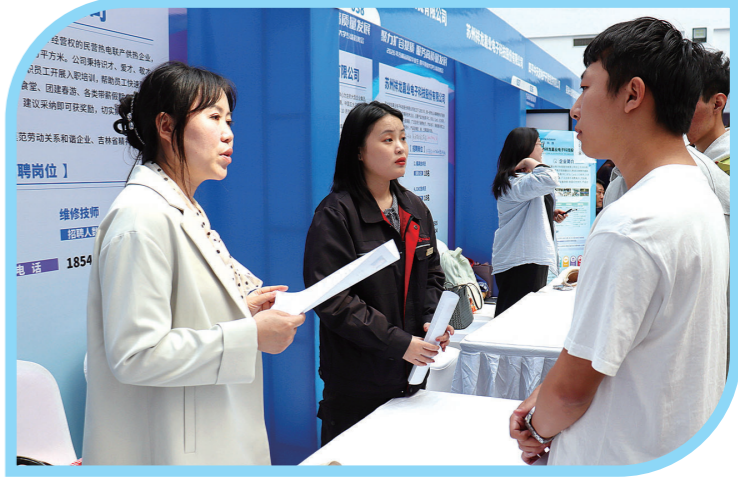
企业招聘人员为学生作招聘信息解读