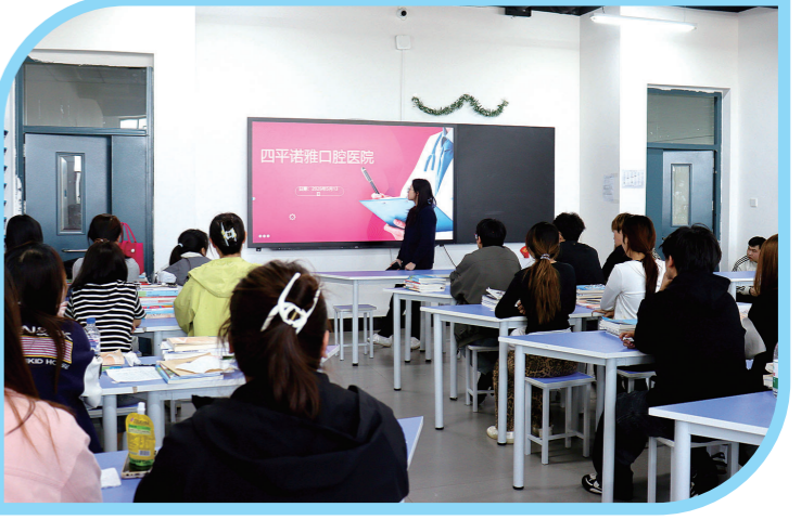
招聘企业到教室宣讲

岗位送进校园,梦想从此启航。这场专场招聘会,是政校企协同发力稳就业、促发展的务实举措,也是学校办学成果与育人成效的集中展示。四平职业大学将以此次活动为契机,持续聚力提质扩容,以更实举措、更优服务护航学子青春逐梦,为服务地方发展贡献更大力量。