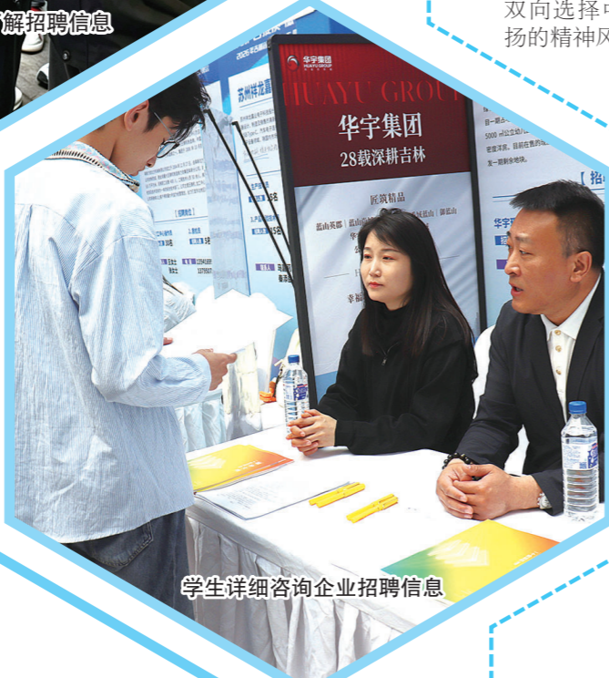
学生详细咨询企业招聘信息