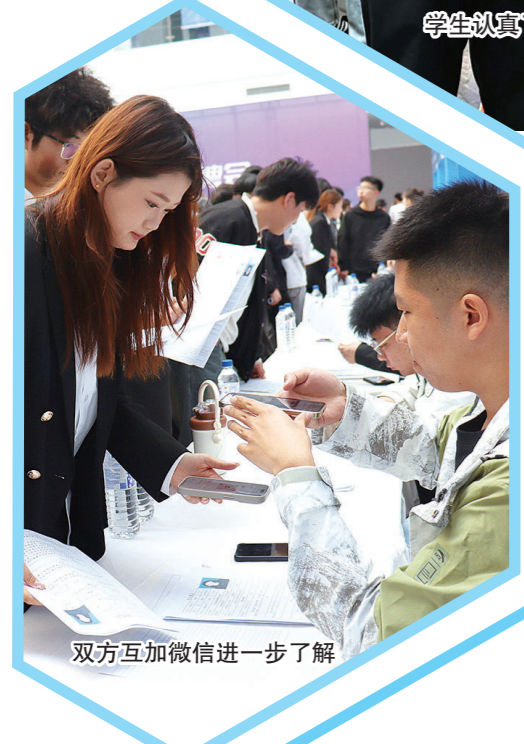
双方互加微信进一步了解