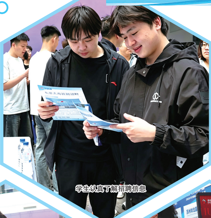
学生认真了解招聘信息