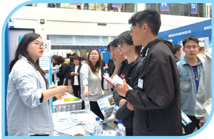
学生现场咨询聘用岗位情况

作为1983年建校的公办全日制普通高等专科学校,四平职业大学始终把毕业生就业工作摆在突出位置。学校常态化开展职业规划与就业指导课程及专题讲座,引导学生树立正确就业观,精准定位职业方向;主动走访企业,深挖优质岗位,搭建实习就业一体化平台;对就业困难学生实行一对一精准帮扶,全程跟踪指导。目前,学校已与百余家公司建立稳定合作关系,大批学子成长为技术骨干、行业精英。