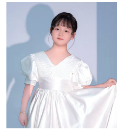
活在和平年代,是一件多么幸运的事。作为一名二年级的小学生,一名光荣的少先队员,这次研学活动给了我很大的鼓舞。今后,我一定会把对革命先烈的敬仰化作学习的动力,努力学习文化知识,按时完成作业,积极参加班级活动,争做勤奋好学、乐观向上的好学生。同时牢记革命精神,珍惜现在的幸福生活,长大后报效祖国,成为对社会和对国家有用的人。

这次塔子山研学活动,让我收获满满,我不仅亲眼看到了红色革命遗址,更深刻懂得了今天的幸福生活来之不易。从前,我们只在课本里听过革命先辈的故事,这次亲身来到他们战斗过的地方,听着老师的讲解,我真切感受到了革命先辈们不怕牺牲、热爱祖国的伟大精神,也明白了我们生