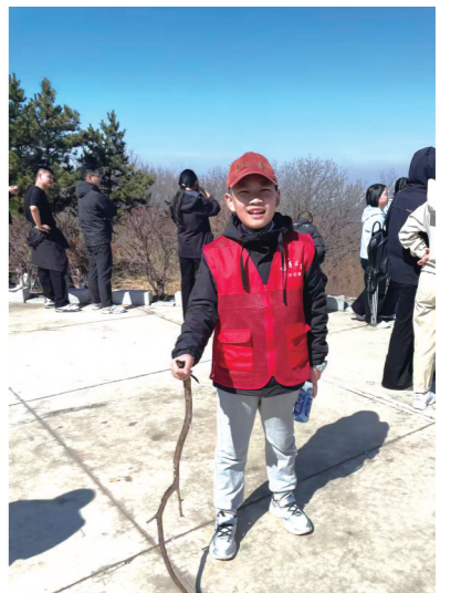
的!今后,我一定要好好学习,长大后报效祖国,不辜负先辈们的付出。

这次研学之旅不仅让我收获颇多,更让我懂得了和平生活来之不易,这都是革命先辈们用鲜血和生命换来