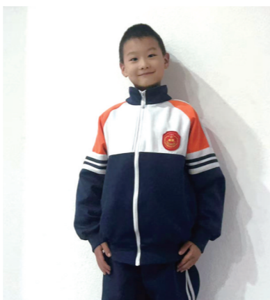
易,是无数英雄用鲜血和生命换来的。作为新时代的小学生,今后,我要好好学习、奋发向上,做勇敢、上进的好少年,不辜负革命先辈的付出,努力为祖国、为家乡贡献自己的力量!

这次研学活动,让我收获满满,不仅锻炼了身体,磨炼了意志,更深刻懂得了今天的幸福生活来之不易,是无数英雄用鲜血和生命换来的。作为新时代的小学生,今后,我要好好学习、奋发向上,做勇敢、上进的好少年,不辜负革命先辈的付出,努力为祖国、为家乡贡献自己的力量!