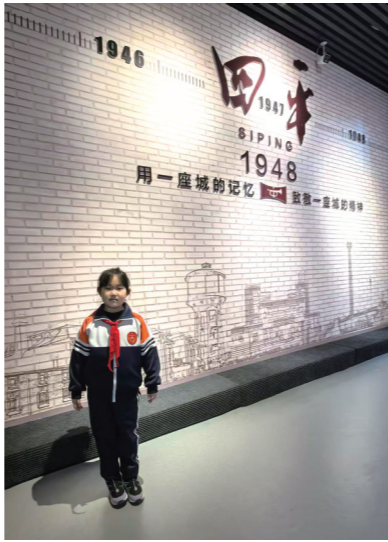
努力成长为担当民族复兴大任的新时代栋梁之才,守护好先辈们用鲜血换来的山河无恙、国泰民安。

今后,我们将传承英雄精神,以先烈为榜样,珍惜来之不易的幸福生活,刻苦学习、奋发向上,践行初心使命,