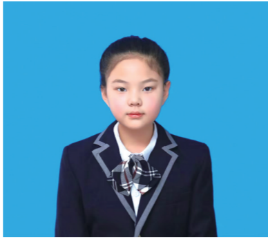
山河静好,一派祥和安宁。如今的和平生活,都是革命先辈们用鲜血和生命换来的,是多么的来之不易。此次塔子山研学之旅让我深受触动、倍感振奋。我们生在红旗之下,长在春风里,身为新时代少年,更应珍惜当下的幸福生活,铭记历史、缅怀先烈。今后我一定要刻苦学习,践行少年担当,争做新时代好少年,用青春和力量守护这锦绣山河、盛世中华。

历经跋涉,我们终于登顶!雄伟的“浴血丰碑”群雕巍然矗立,战士们持枪冲锋、摇旗呐喊的姿态栩栩如生,仿佛将那段烽火岁月重新呈现在眼前。站在观景台上极目远眺,四平城区的繁华美景尽收眼底,车水马龙、