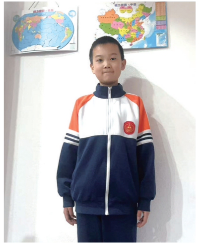
不仅要铭记历史,更要传承先烈的精神,用奋斗书写属于我们的青春。

在山顶的纪念碑前,我们整齐列队,庄严敬礼。老师带领我们重温入党誓词,铿锵有力的誓言响彻山间。随后,老师还带领我们开展红色故事分享会,同学们踊跃发言,分享自己了解的革命故事,传承红色精神。那一刻,我明白,作为新时代的少年,我们