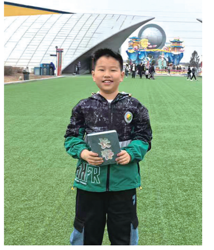
了塔子山的历史,更读懂了那段血染山岗的壮烈历史,作为家乡的小小少年,我一定铭记历史,珍惜当下,好好学习,把红色精神传承下去,守护好我们美丽的家乡,长大后,做一个对国家、对社会有用的人。