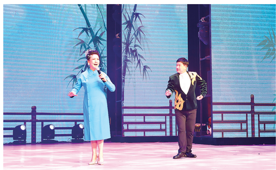
近日,“艺心向人民 曲韵进万家”文化惠民演出在梨树县上演,吉林省二人转艺术团携手众多优秀文艺工作者联袂登台,为广大群众献上了一场精彩纷呈的文艺盛宴,让百姓在家门口尽享优质“文化大餐”。