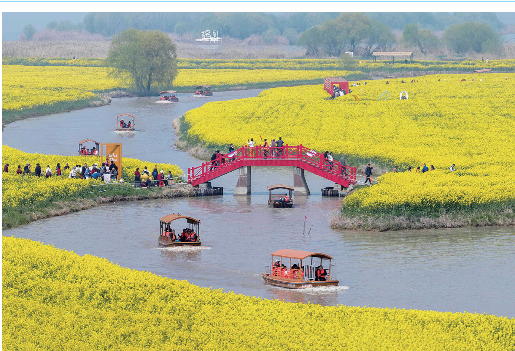
3月28日,游客在江苏省高邮市湖上花海景区赏花游玩(无人机照片)。随着气温回升,各地美景如画,神州大地春色满满。