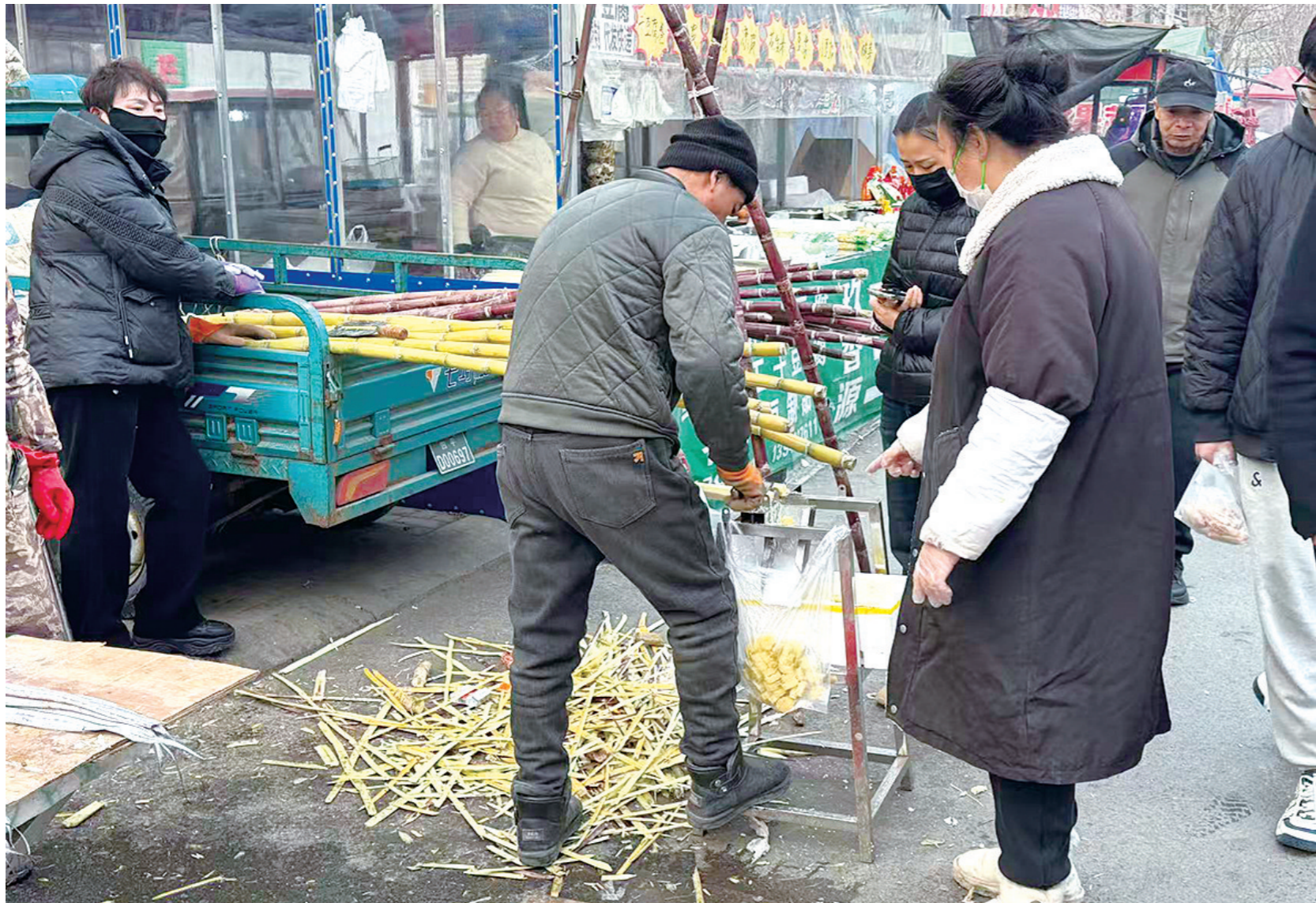
初春时节,甘蔗因其清甜多汁的特性备受市民喜爱,甘蔗摊前客流不断。这是在铁东区八马路的一家甘蔗摊前,摊主正在为顾客处理甘蔗。

为了更好地宣传2026年“3·15”工作重点,针对“两员一老一少”群体易遭遇的非法金融活动,建信人寿四平中心支公司特别做出以下风险提示,提醒广大金融消费者提高警惕,防范风险: 外卖员、快递员风险提示: 户外奔波风险高,警惕“低价假保单、代办理赔、非营运车险拒赔”;投保认准官方渠道,看清免责条款,优先配齐意外险、第三者责任险,守护奔波安全。 老年群体风险提示: 守护养老钱,警惕“免费赠险、高收益理财、代理退保”骗局;不泄露身份证、银行卡、验证码,不签订空白合同,大额投保先与家人商量,只选正规保险机构。 青少年风险提示: 理性投保不盲从,远离网络弹窗不明保险链接,校园借贷捆绑保险;不随意授权个人信息,不超前投保高保费产品,按需配置基础保障,树立正确保险消费观。 两员一老一少通用提示: 警惕“全额退保、保单升级、内部优惠”等误导话术,维权、咨询仅联系保险公司官方客服与正规网点,拒绝陌生中介代办,严防信息泄露与财产损失。 全人群守护提示: 投保先看资质、细读条款、如实告知;理赔走正规流程,不相信“捷径理赔”;理性选择保障,不盲目跟风,守住保险消费底线,安心享有保障。 警惕“高收益”陷阱: 任何承诺“保本高息”“零风险、高回报”的金融产品或投资项目,均可能属于非法金融活动,尤其是老年群体,切勿轻信“养老投资”“以房养老”等虚假宣传,守住自己的养老本金;外卖员、快递员群体切勿因急于增收,陷入“低投入、高回报”的诈骗圈套。 远离非法代理退保:警惕陌生人以“代理退保”“退保返利”为由,诱导泄露个人信息、签订虚假协议,此类行为可能导致个人信息泄露、资金受损,甚至承担法律责任,如有退保需求,务必通过保险公司官方渠道办理。 保护个人金融信息:不随意向陌生平台、陌生人透露身份证号、银行卡号、手机验证码等核心信息,不点击不明链接、不下载非官方APP,青少年群体切勿因好奇点击网络弹窗中的金融相关链接,避免个人信息被非法利用。 选择正规金融渠道:投保、投资需选择持牌金融机构及正规金融产品,仔细阅读合同条款,明确保障范围、风险提示及权益边界,不盲目跟风投保、投资;如遇金融消费纠纷或疑似非法金融活动,及时向金融监管部门投诉举报,依法维护自身合法权益。 建信人寿四平中心支公司在此呼吁,广大金融消费者主动学习金融消费知识,增强风险防范意识,自觉远离非法金融活动,共同守护自身财产安全,共建清朗金融环境。