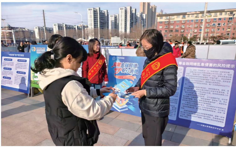
活动现场,工作人员通过发放宣传折页、现场解答等方式,向群众普及保险知识,提升公众金融素养。

3月15日是第44个国际消费者权益日,为深入贯彻国家金融监督管理总局四平监管分局工作部署,践行金融工作政治性、人民性,四平保险业协会统筹协调会员单位,以“清明金融网络 守护安心消费”为主题,全面启动2026年“3·15”金融消费者权益保护教育宣传活动,以精准宣教、扎实举措筑牢消费安全防线,提升公众金融素养。