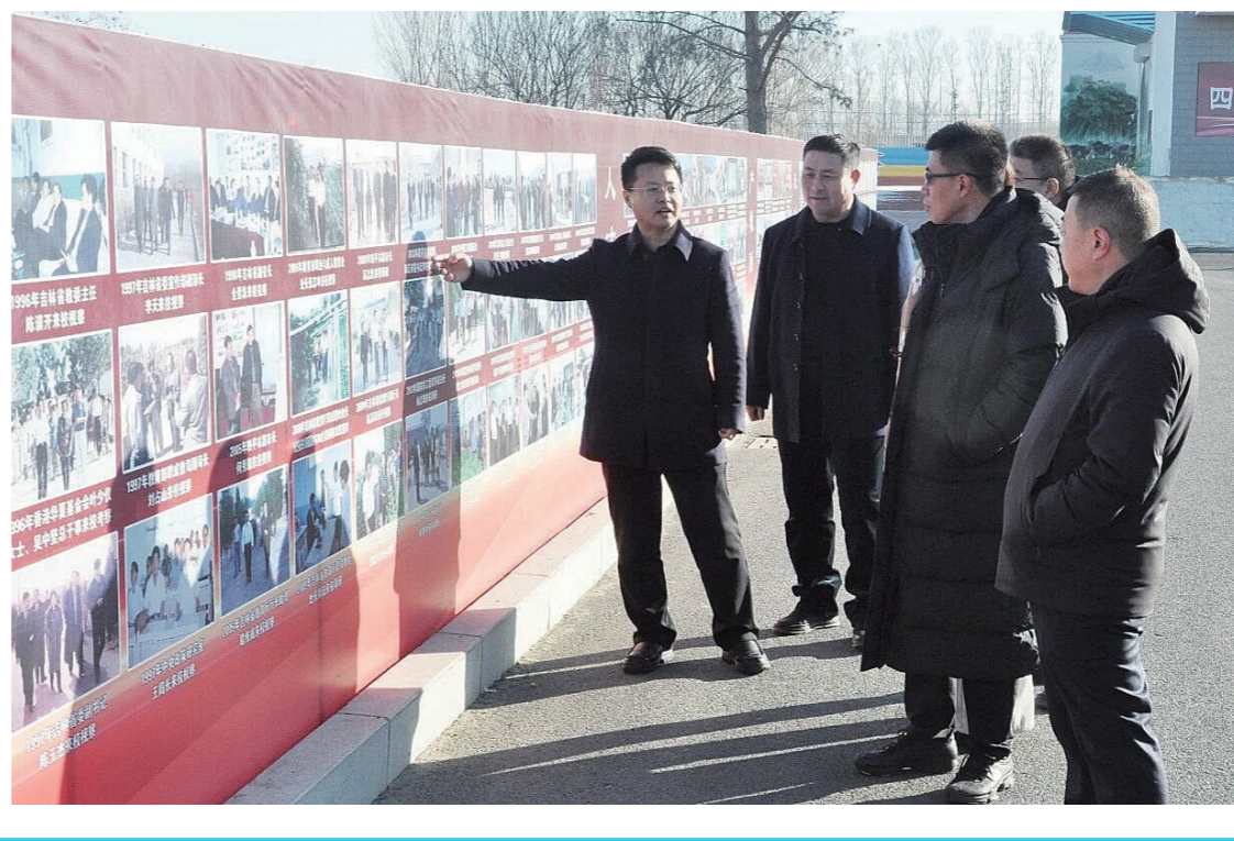
近日,中国职业技术教育学会一行深入双辽市职业中专,围绕农村职业教育办学模式、服务乡村振兴成效等开展调研。