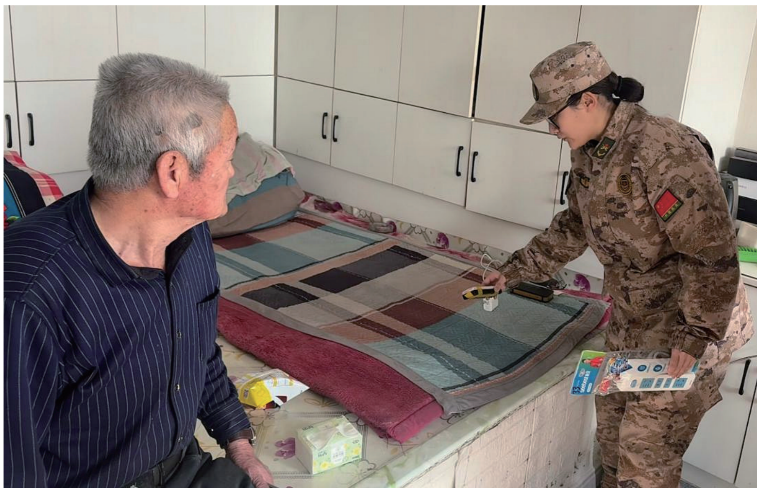
近日,双辽市王奔镇民兵应急排开展走访慰问,并紧密结合乡镇用火用电特点,开展“一对一”安全服务。

燃放等行为。检查组还督促经营者们要把安全责任落到实处,对检查中发现的问题隐患,检查组现场提出整改意见,明确整改时限。双辽市各相关部门将持续强化联合执法,常态化开展隐患排查整治,引导经营户规范经营、诚信经营,营造“人人关注安全 人人重视安全 人人参与安全”的良好社会氛围,全力以赴以高标准、硬举措筑牢烟花爆竹安全防线。