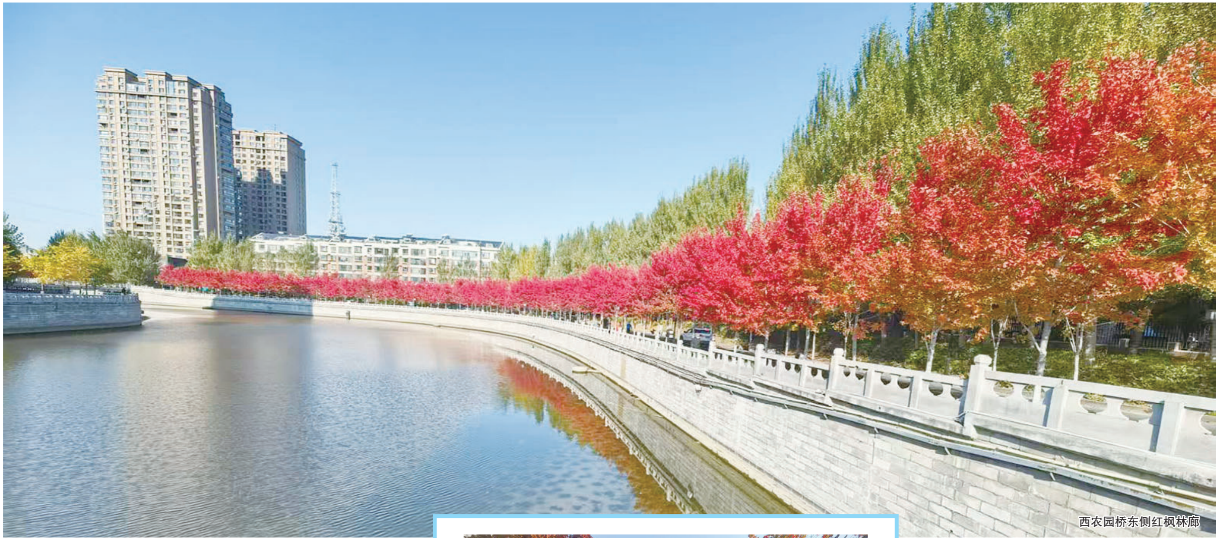
西农园桥东侧红枫林廊

如今的四平，城美貌秀、楼阔房新、路宽且畅。市委、市政府以高点规划引领城市发展，坚持一张蓝图绘到底，砥砺奋进、笃定前行，城市建设交上了一份精彩的答卷——市区高楼鳞次栉比，城乡道路宽广通畅，一片片绿地青翠葱郁，一张张笑脸幸福洋溢……穿行在英城大地，处处是充满魅力的风景。