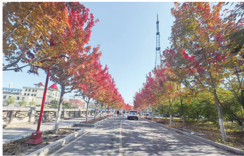
南湖公园附近红枫林廊

实施农村危房改造。2025年度，我市共实施农村危房改造任务717户（铁东区34户、铁西区13户、梨树县32户、双辽市37户1、伊通267户）共争取中央专项补助资金1219万元。截至2025年末，已全部建设竣工，危房改造资金均已发放至农户“一卡通”中，累计完成投资总额3200.49万元，如期完成2025年农村危房改造任务。