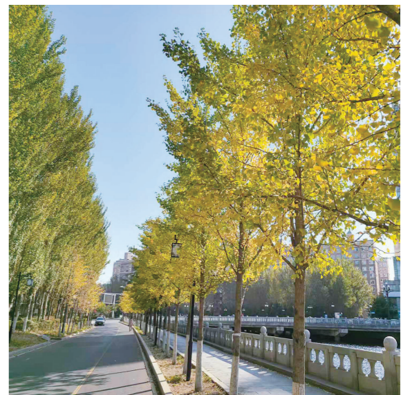
南河岸边银杏林廊

强化房屋安全。如期完成717户农村危房改造任务，争取中央专项补助资金1221万元。全市排查大跨度结构建筑共计4857个，排查存在隐患建筑21个，完成整治21个。