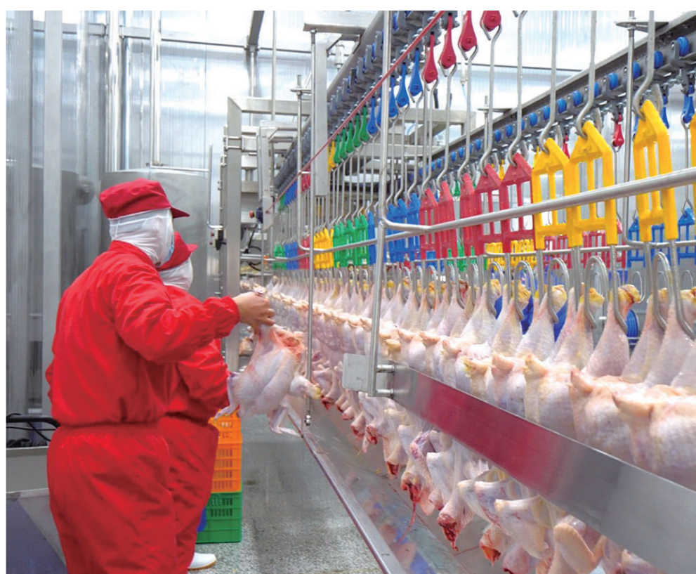
四平禾丰食品有限公司生产车间

岁序更迭启新程，奋楫扬帆再出发。新的一年，我市将锚定“千亿级经济总量”目标，持续深化“招商引资竞赛年”行动，大力开展“招商能力提升年”活动，以更精准的举措、更务实的作风、更优质的服务，精准施策、聚力攻坚，全力推动一批标志性、引领性项目落地生根、开花结果，为四平全面振兴实现新突破提供坚实支撑、积蓄发展势能。