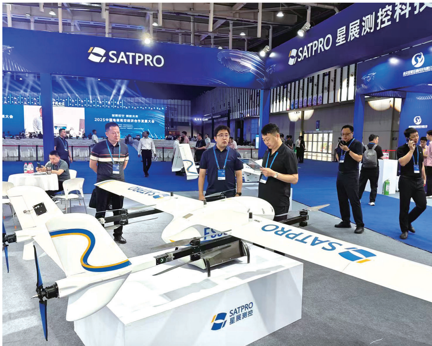
我市参加“2025年中国电信低空经济合作发展大会”

过去的一年，全市招商引资工作呈现稳中有进的良好态势，1-12月，全市市外1000万元以上有资金到位的项目337个，实现到位资金218.82亿元，中煤绿能新能源化工耦合一体化、农业大数据2000P智算中心等一批投资规模大、产业关联度高、带动能力强的优质项目成功落地，为全市经济稳中向好、进中提质筑牢了坚实支撑。