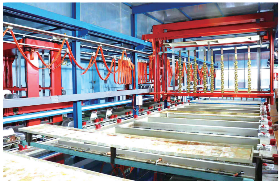
四平市启运金具有限公司

过去的一年，四平市锚定高质量发展目标，以工业强基、消费焕新、就业惠民为三大抓手，交出亮眼答卷。工业赛道上，项目建设梯次推进，“专精特新”企业梯队壮大，智改数转与产科融合双向赋能，筑牢发展硬支撑；消费市场中，政策杠杆撬动活力，夜经济与跨区域合作多点开花，点燃增长新引擎；民生领域里，精准服务破解就业供需矛盾，创业带动就业成效显著，厚植幸福底色。这份量质齐升的成绩单，彰显了四平顶压前行的魄力与担当，更为未来发展积蓄了澎湃动能。