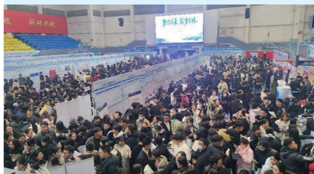
“职引未来 筑梦吉林”吉林省高校毕业生秋季招聘会暨吉林师范大学2026届毕业生秋季双选会在吉林师范大学(四平校区)体育馆圆满落下帷幕。

引力和品牌影响力。强化政策赋能。扎实开展消费品以旧换新工作，2025年，已争取以旧换新国补资金1.6亿元、拉动消费9.82亿元。并围绕消费高频需求，分阶段、分品类、分额度推出多轮消费券补贴活动，市本级共发放消费券1700万元，其中汽车类消费券1280万元，成品油、商超、服饰类消费券400万元，家电类20万元，合计拉动消费约7亿元，实现1:46.81的政策杠杆效应。