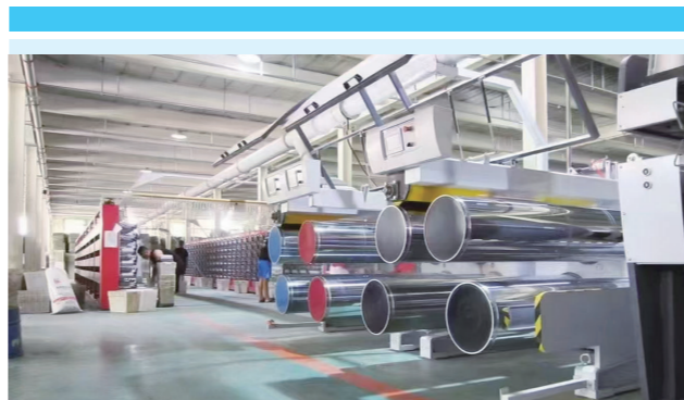
四平市博利塑编有限公司