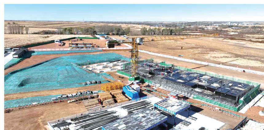
吉电股份梨树绿色甲醇项目

岁月鎏金，奋楫者先。2025年的坚实步履，为“十五五”开局之年积蓄了磅礴力量。站在新的历史起点，我们将以一如既往的奋斗姿态、风雨无阻的精神状态，锚定目标、勇毅前行，在推动经济社会高质量发展的征程上续写新的华章，为谱写中国式现代化四平篇章而努力奋斗。