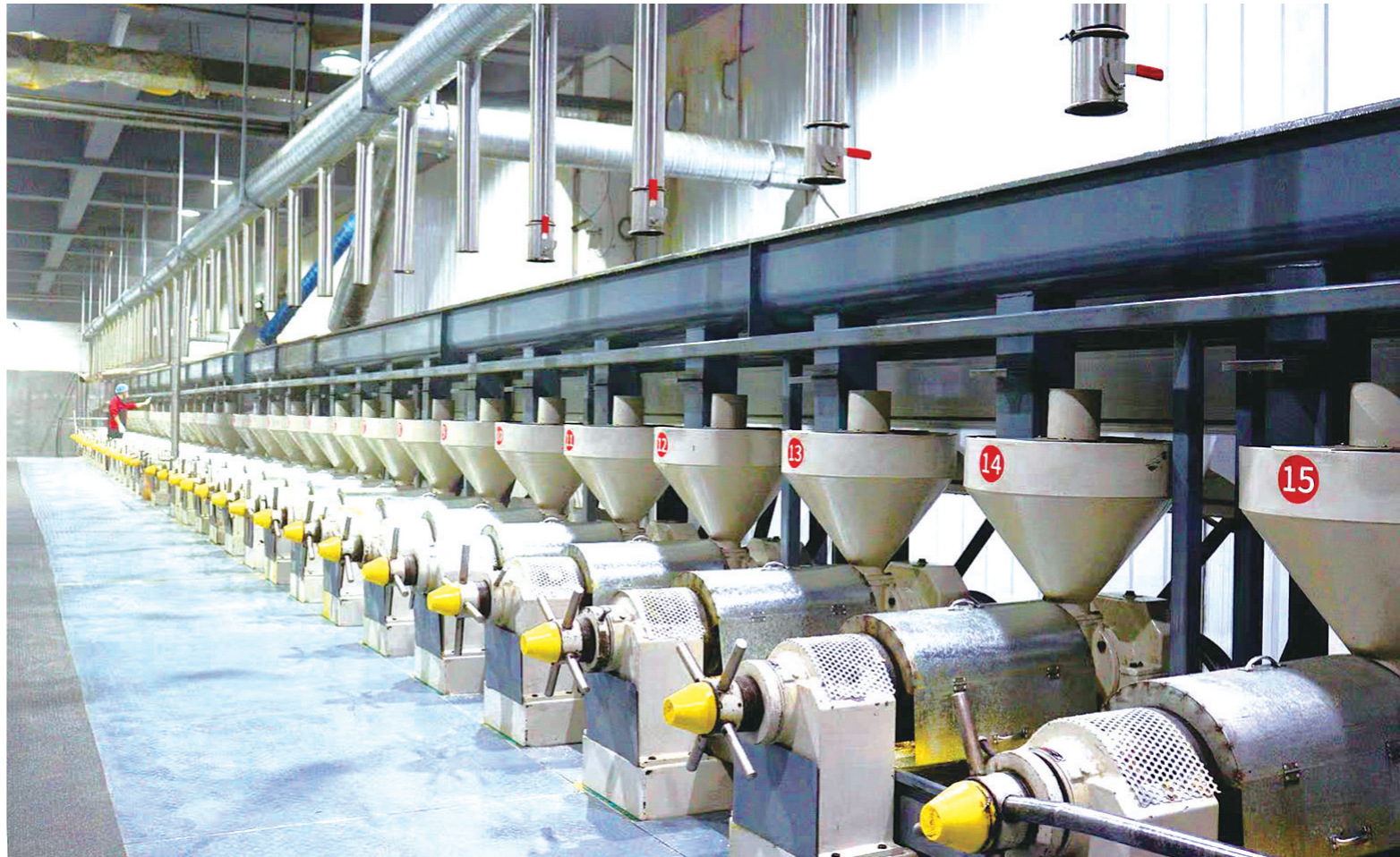
吉林省弘丞生物科技有限公司

产科融合，集聚工业发展动能。坚持科技创新与产业创新深度融合，建强平台载体，集聚创新发展动能。一是推动校企开展联合攻关。全年共征集校企合作攻关项目20个，其中巨元与长春理工大学合作研发的低成本板对板焊接激光技术、艾斯克与中国科学院沈阳自动化所合作的家用剔骨设备中的X光骨实时检测系统研发等一批项目取得重要突破。二是建设企业技术中心。立新汽车、巨元集成的技术中心成功认定市级企业技术中心。截至目前，全市共建成省级企业技术中心29户、市级企业技术中心8户。三是搭建创新创业展示平台。成功举办第十届“创客中国”中小企业创新创业四平地区赛，大赛共征集32个创业项目，推送9个项目至省赛。其中，微光科技团队“光感守护者，全球耐药菌破局之光”项目获创业组三等奖，有效吸引一批产业人才和创业团队。