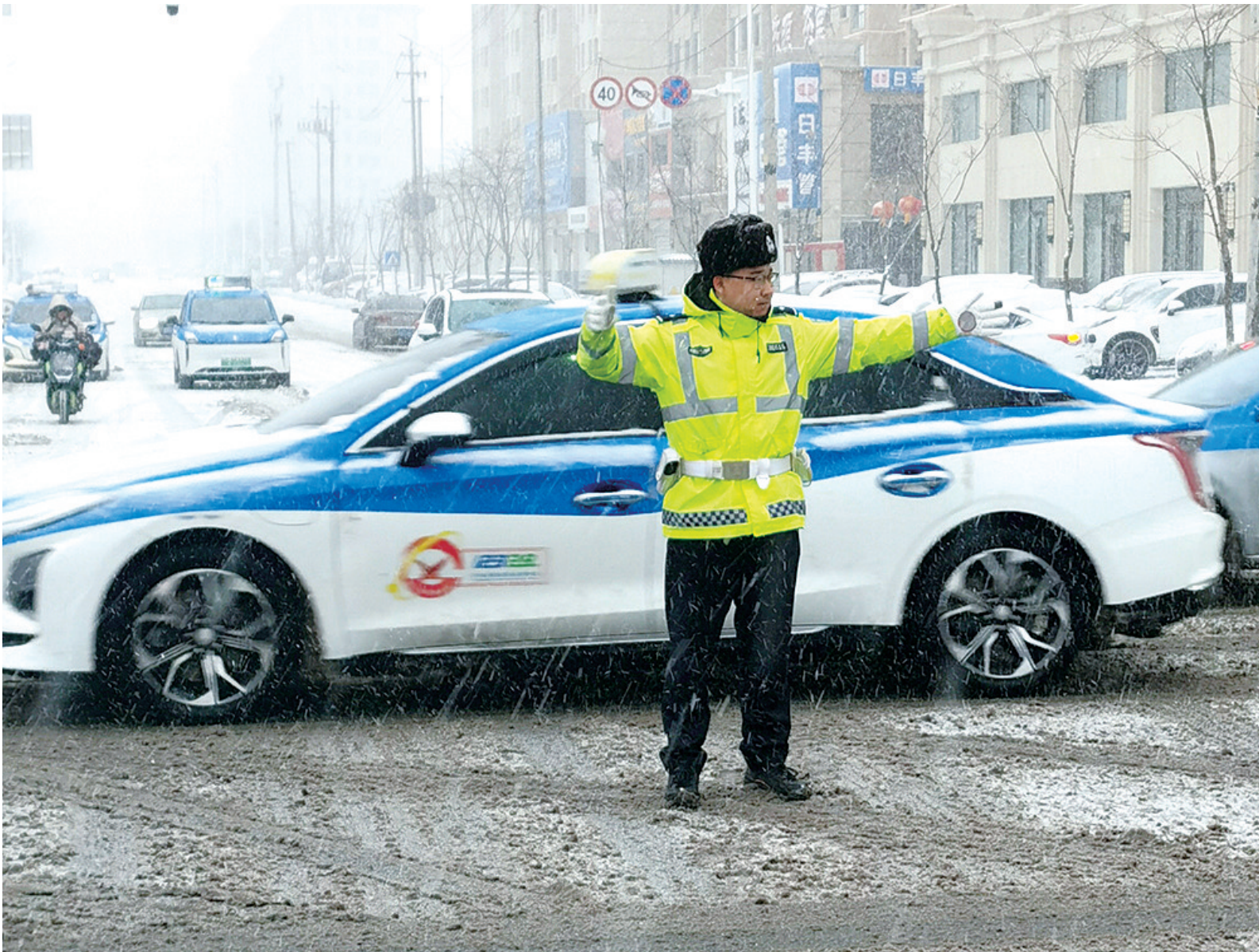
12月23日,我市迎来降雪,漫天飞雪给广大群众出行带来安全隐患。市交警支队民警闻雪而动,用坚守与担当为群众出行保驾护航。

此次活动的开展不仅解决了居民的“急难愁盼”问题,更消除了小区潜在的安全隐患。南湖社区相关负责人表示,将继续从居民的实际需求出发,全心全意为群众办实事、解民忧,用实际行动温暖民心,努力增强辖区内居民的获得感、幸福感和安全感。