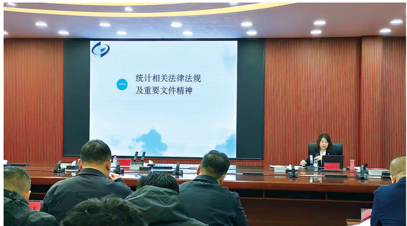
宣讲新修改统计法

今日刊文，是铁西统计人守正创新、践行法治的生动实践。期待以此次宣传为契机，让新修改统计法的权威意义家喻户晓，让法治思维贯穿统计工作全过程，让真实、准确、完整、及时的统计数据，成为铁西铁西区全面振兴发展新图景的“数字画笔”，成为服务四平高质量发展的坚实基石，为新时代统计法治建设书写基层实践的精彩答卷。