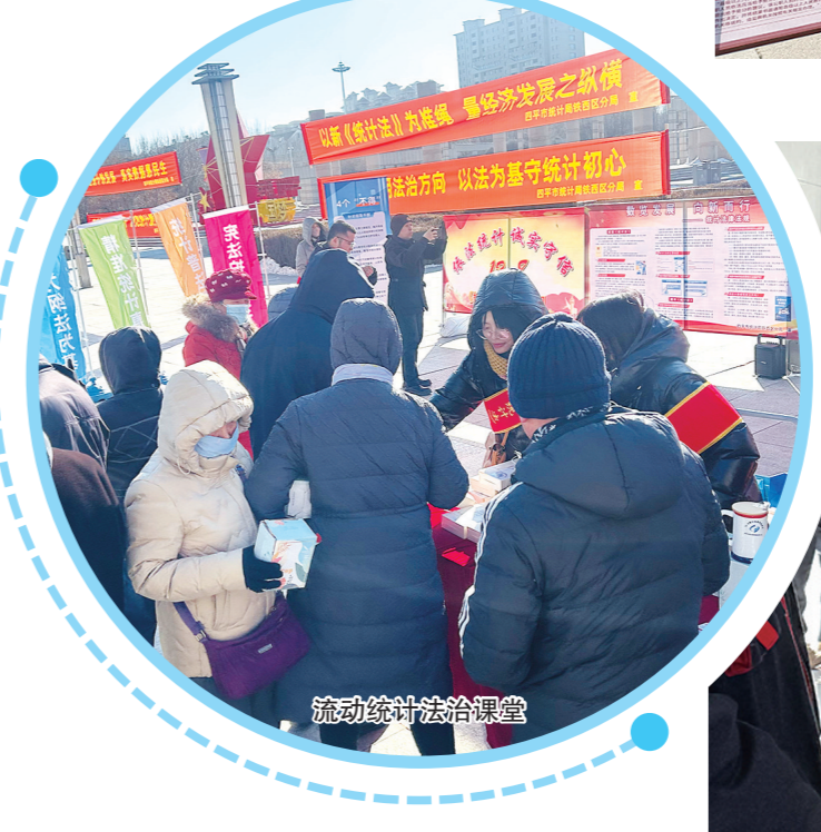
流动统计法治课堂

等重要讲话和重要指示批示精神，以提高数据质量为中心，以高质量统计服务经济社会高质量发展，切实提升领导干部依法管理统计、依法用统计的政治自觉与履职能力。