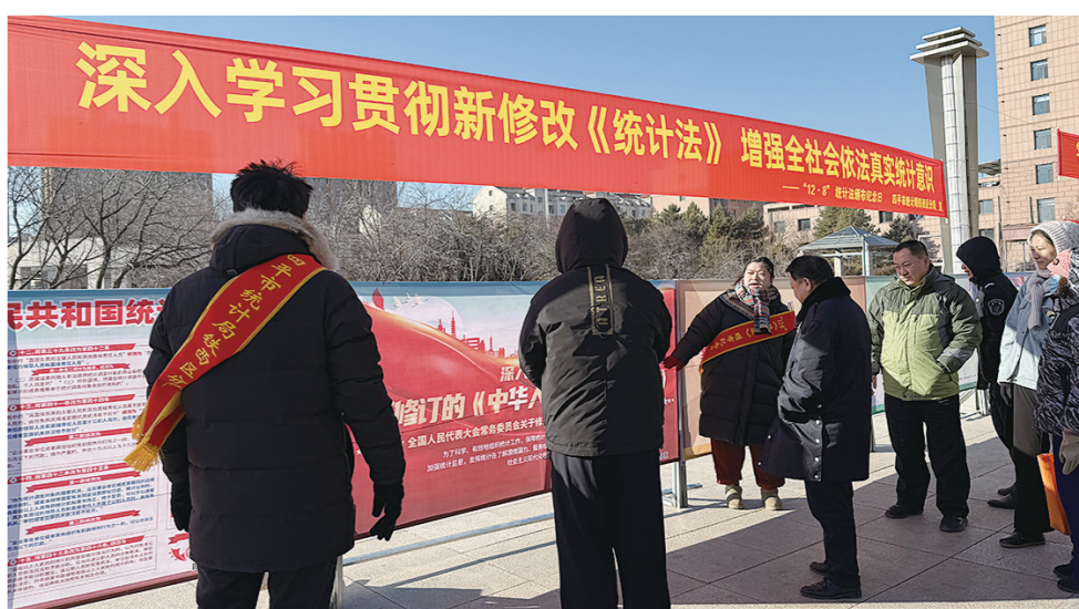
群众在展板前驻足观看