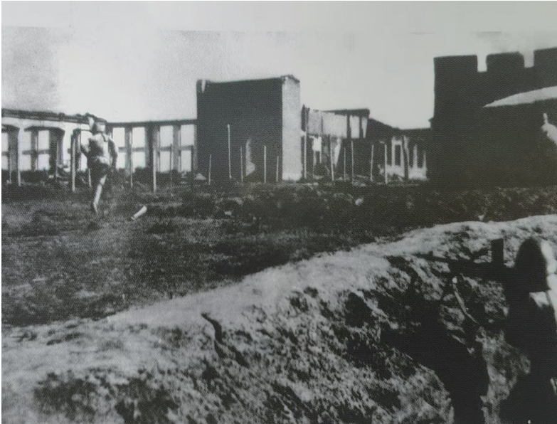
攻城大军突入市区