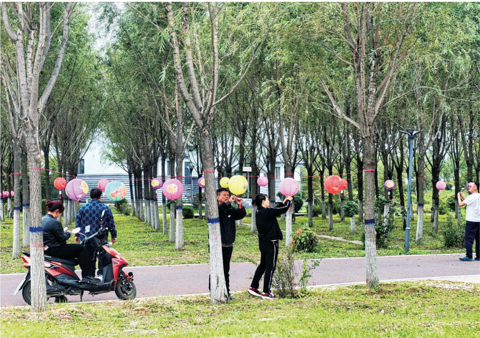
近日，梨树团委与吉林省峰通农业科技有限公司共同打造的“梨树寻宝”主题活动在梨树南河公园举行。活动不仅吸引了本地市民踊跃加入，更汇聚了来自全国各地的房车爱好者，大家在欢乐祥和的氛围中，开启了一场别开生面的“寻宝”之旅。

(一)借款申请人向市住房公积金管理中心提出“商转公”贷款申请，市住房公积金管理中心对借款申请人是否符合“商转公”贷款条件进行审核； (二)“商转公”贷款申请经市住房公积金管理中心和受委托银行审核同意后，与借款申请人签订《个人住房公积金借款合同》； (三)办理顺位抵押登记手续； (四)市住房公积金管理中心将公积金贷款资金划入借款申请人原商业住房贷款银行结清原商业住房贷款，“商转公”借款申请人将还款资金(结清原商业贷款差额部分)存入借款申请人原商业住房贷款银行，结清原商业贷款。 (市住房公积金管理中心供稿)