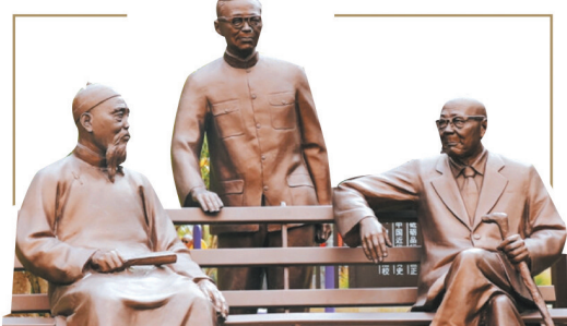
无锡抗日青年流亡服务团纪念馆铜像。

抗日战争是中华民族存续的关键一战，无数中华儿女以血肉之躯、勇气和智慧守护着民族的火种。在江南名城无锡，面对山河