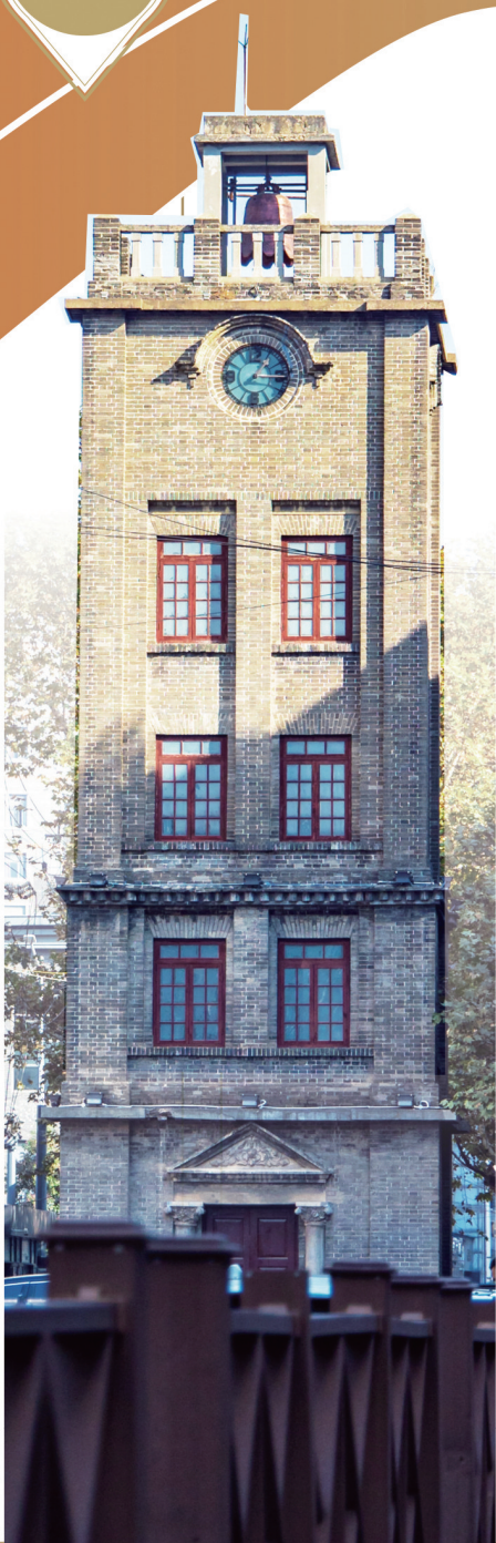
徐州大同街钟楼现状。