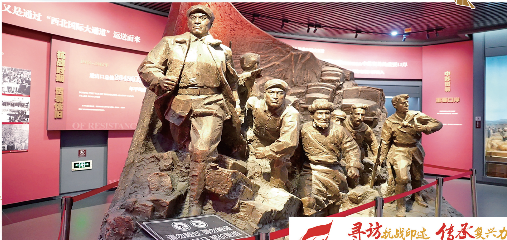
在霍尔果斯市国门文化展示馆里，这座展现抗战时期，转战伊犁的东北抗日义勇军战士和伊犁各族群众抢修西北国际大通道的群塑，鲜活地彰显了伊犁各族人民团结一心、共御外辱的伟大民族精神。