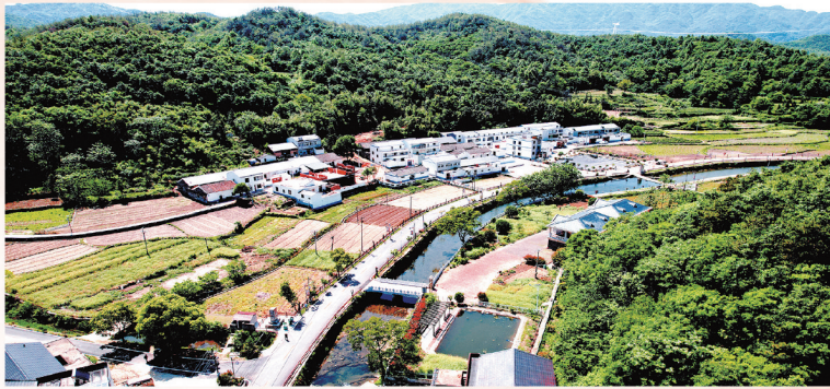
全国红色美丽乡村白果树湾