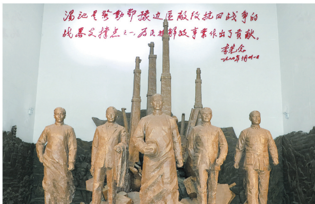
汤池训练班创办人雕像

据统计，2024年，大悟县接待游客达790万人次，综合收入45亿元，10万余村民吃上“旅游饭”。