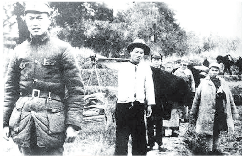
李先念（左一）率新四军豫鄂挺进纵队进入鄂中地区（资料照片）

1941年至1945年，新四军第五师在极其艰苦的条件下，面对日本侵略者的多次围剿和扫荡，英勇顽强、不屈不挠，进行了1260多次主要战斗，阻击了近15万日军的进攻，建立起以大悟山为中心、跨鄂豫皖湘赣五省边界的抗日民主根据地，有力支持了全国抗战。