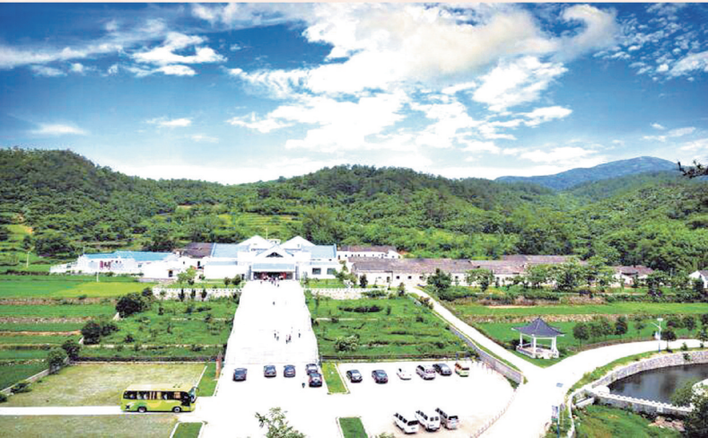
新四军第五师司令部旧址景区