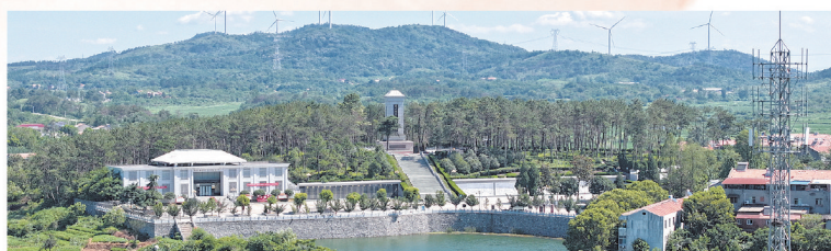
赵家棚抗日烈士陵园