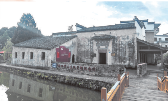
位于安徽徽州的新四军二支队琶塘纪念馆。

告照片静静陈列。虽历经岁月冲刷，其上“本军奉命抗战，志在保国卫民”“军民联成一体，相敬相爱相亲”的字句仍清晰可辨。这些字句化作战士们扫地挑水的身影，融入宣讲抗日道理的声浪，刻进了琶塘的日常。古村墙上，新四军用红土刷写的标语历经风雨依然醒目：“驱逐日寇出中国”“收复失地”“保卫家乡”……字字句句，都是军民鱼水情深的生动见证，亦是那段峥嵘岁月永不褪色的印记。