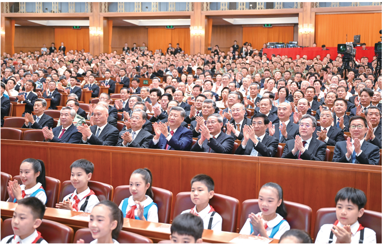
9月3日,纪念中国人民抗日战争暨世界反法西斯战争胜利80周年文艺晚会《正义必胜》在北京人民大会堂隆重举行。习近平、李强、赵乐际、王沪宁、蔡奇、丁薛祥、李希、韩正等党和国家领导人,与约6000名中外人士一起观看晚会。