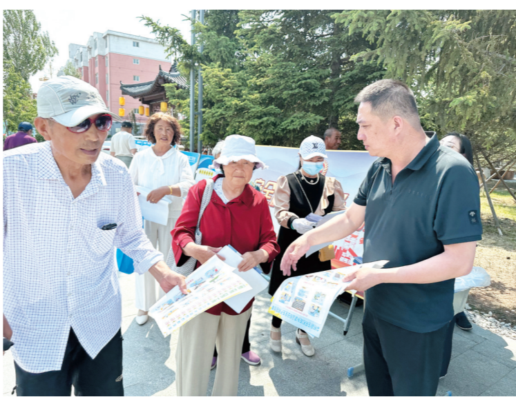
近日,为进一步增强广大群众安全生产意识,营造“人人讲安全 个个会应急”的社会舆论氛围,梨树县应急管理局联合县商务局、县教育局等20余家相关企业单位开展安全宣传咨询日活动。