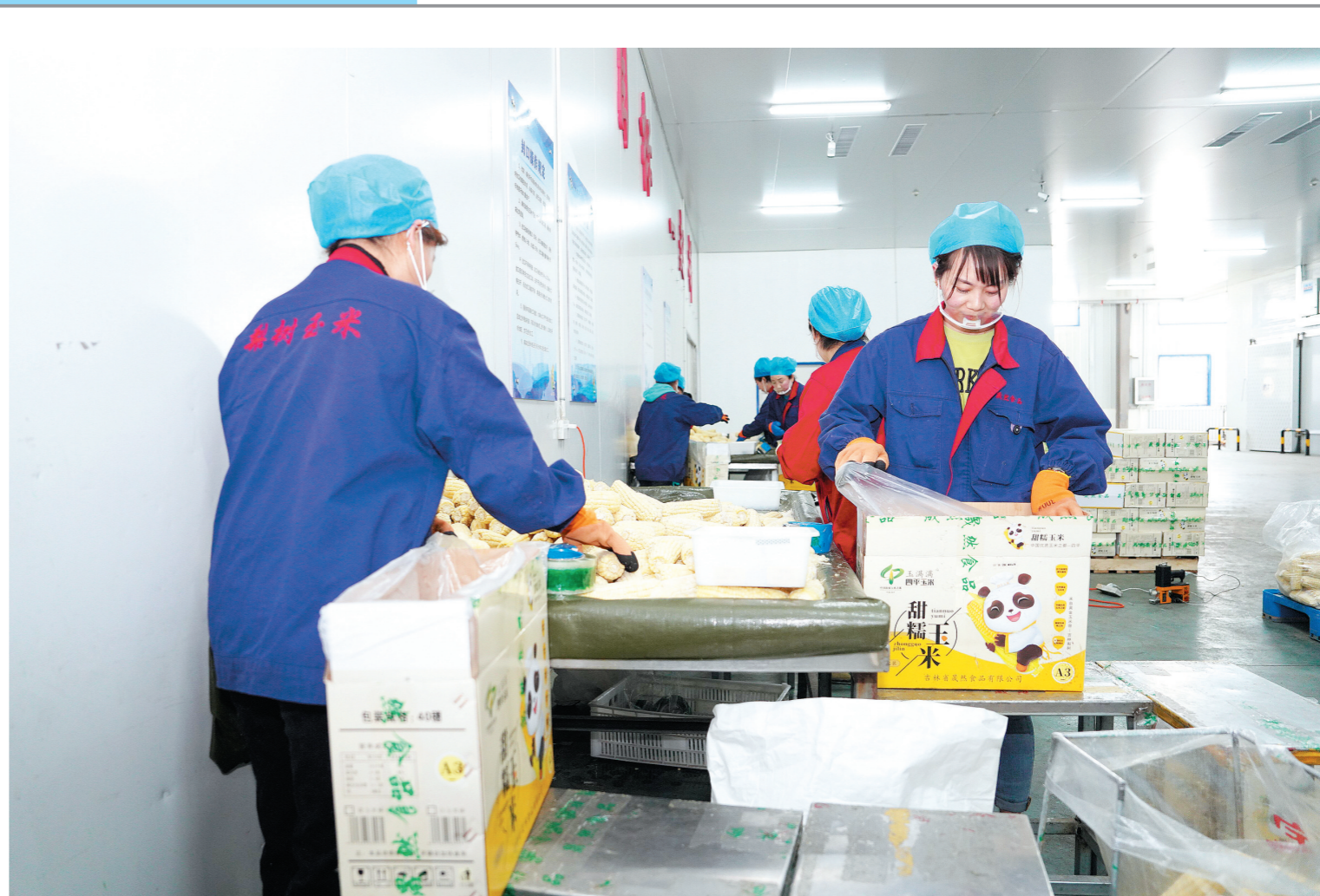
近年来,梨树县围绕“4+1”全产业链,积极壮大农业优势特色产业,推进一二三产业深度融合,打通产业发展堵点,推动农业产业发展壮大、转型升级,助力经济社会高质量发展。这是吉林省昊然食品有限公司员工正在将速冻玉米打包装箱。

学生主题沙游作文《我想对您说》,以写作和沙盘游戏心理疗法相结合,带领孩子们一起感受沙盘作文这一创新写作形式的神奇,为孩子营造一方安全、自由的心灵空间。学生主题团建“情绪盒子”活动,让学生们真正实现了玩中学、学中悟、悟中思,更加清晰地认识到自己的优缺点,激发学生探索欲望,增强了自信心,并形成团队成员间互相协作、积极向上、团结互助的良好氛围。