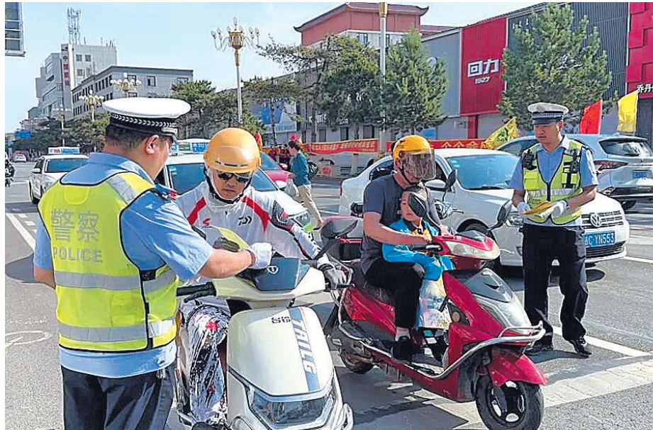
近日,为进一步加大安全生产宣传力度,普及安全知识,加强全县交通参与者的安全意识,从源头上有效预防道路交通事故发生,伊通公安局交警大队开展了主题为“人人讲安全 个个会应急”的安全生产月集中宣传日活动。