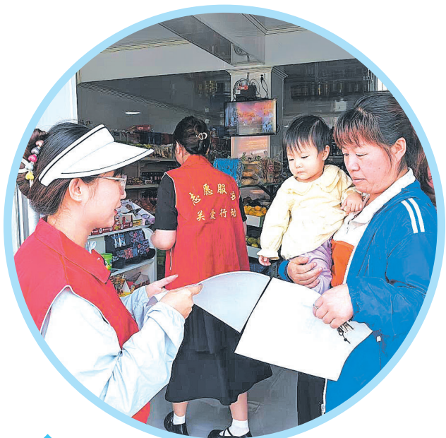
近日,伊通靠山镇组织志愿者开展“防范非法集资”宣传活动,提高广大群众对非法集资的本质及其危害的认识,呼吁网格居民积极参与宣传防范非法集资队伍中来,营造打击非法集资的良好社会舆论氛围。

展退役军人服务保障工作奠定了基础。永宁街道庆阳社区将持续做好退役军人走访慰问、权益维护、优抚帮扶等工作,切实增强退役军人获得感、幸福感、安全感,不断开创退役军人服务工作新局面。