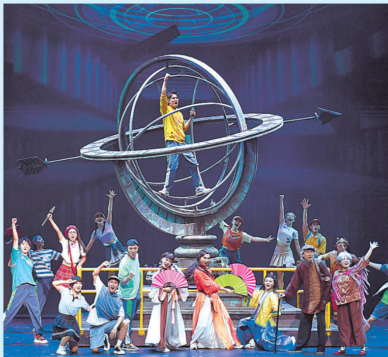
近日,第八届丝绸之路国际艺术节在西安开幕,原创音乐剧《丝路之声》作为开幕演出在西安浐灞保利剧院上演。本届艺术节以“共谱和平之曲,高唱丝路欢歌”为主题,分文艺演出、美术展览、线上展播三大板块。此外还将开展“拉美艺术季”“泰国文化日”“国际儿童戏剧周”“2022西安国际数字互动娱乐文化周”“非遗活动展演”等五项专题活动。演员在第八届丝绸之路国际艺术节开幕演出上表演音乐剧《丝路之声》。