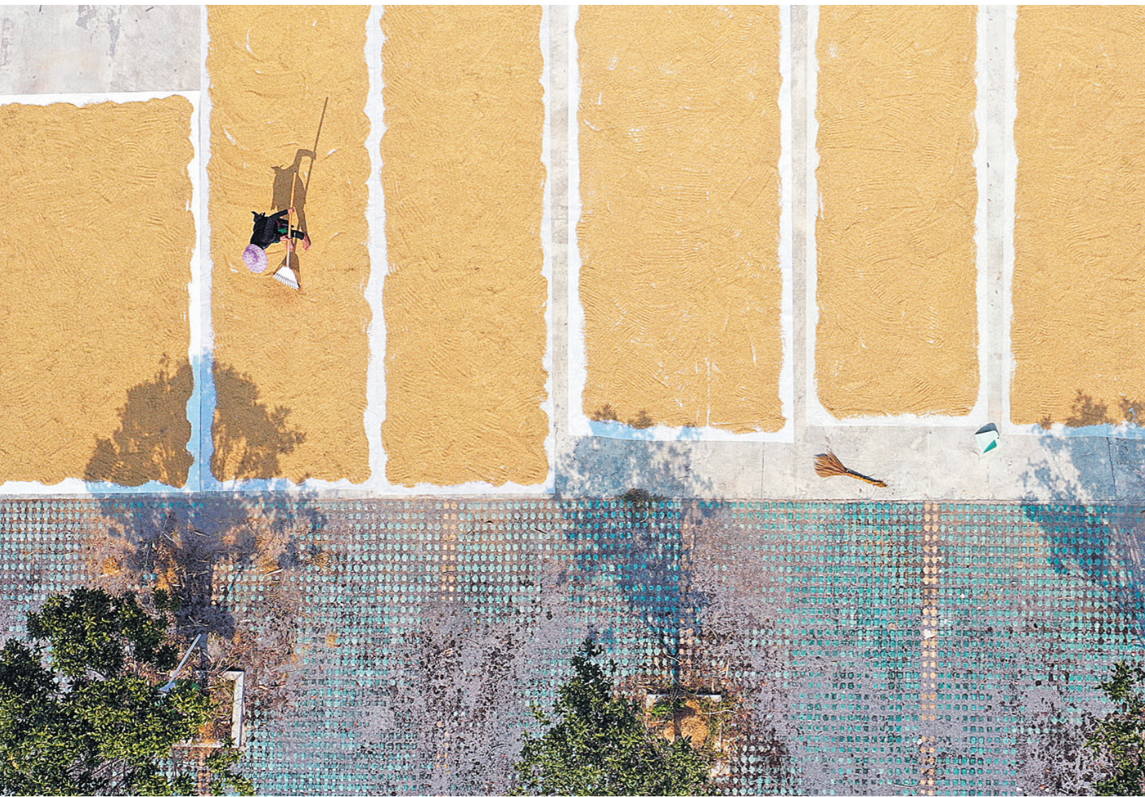
金秋时节,农民忙着收获晾晒,到处是一派丰收景象。村民在贵州省黔东南苗族侗族自治州从江县刚边壮族乡刚边村晾晒稻谷(无人机照片)。

东北抗联博物馆馆长刘强敏说,这一日军侵华新物证的展出,再次印证了日本发动全面侵华战争的罪行,警示人们要勿忘国耻、居安思危,铭记历史、珍爱和平。