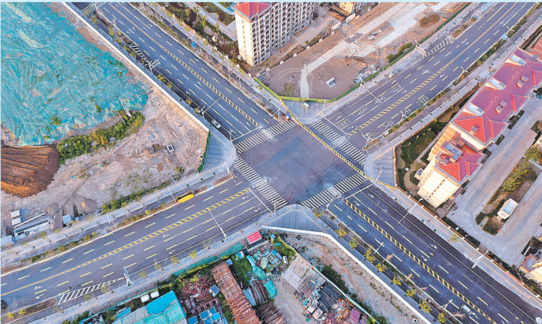
近日,由中铁十一局等单位承建的雄安新区容西片区配套市政道路完成竣工验收,即将投入使用。这是雄安新区容西片区配套市政道路。

有这样的展,得益于党的好政策和人民群众的支持,因此,我很乐意为社会做点事,用自己的实际行动践行义不容辞的社会责任和担当。”这朴实的话语,道出了他赤诚为民的情怀。 高权芳就是这样靠着诚实守信、敬业奉献的精神一路走来,发展了企业,惠及了大家。他也会伴着这两大品质一路走下去,继续推动企业向前发展,为社会为百姓作出更大的贡献。