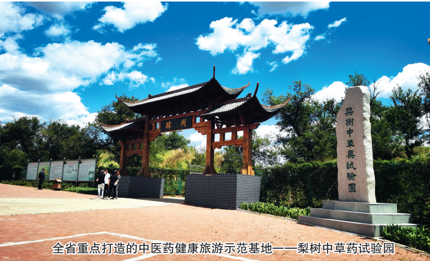
全省重点打造的中医药健康旅游示范基地——梨树中草药试验园

当日,调研组人员在梨树县中医院先后召开了“吉林省中医药学会会员服务需求调研工作座谈会”“梨树县中医药大学生就业情况调研及促进乡村振兴发展专家咨询会”“梨树县中医院中医药健康旅游基地建设专家咨询会”,围绕中医药行业、大健康产业发展、中医药助力乡村振兴、开展中医药健康旅游等四个议题进行座谈交流。会上,梨树县主管领导对梨树县的自然情况、医疗行业发展成果和大健康产业的远景规划尤其是全县中医药产业的蓬勃发展进行了全面介绍。县相关领导分别就中医药健康旅游培养专业人才、弘扬中医药传统文化促进大健康产业高质量发展、如何擦亮县中医药产业项目这张“金名片”、中医药振兴发展关键点和中医药博物馆的内涵建设等不同角度提出了针对性问题和建议,梨树县中医院用视频的方式向参会领导汇报了医院的发展规划和长远规划。县中医院负责人表示,仁心、精术是梨树中医的根,传承、创新是梨树中医的魂,梨树中医人定将戮力同心,让国粹中医在梨城大地绽放出夺目光彩。