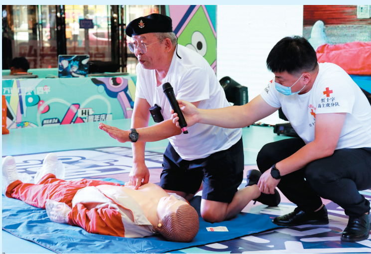
为提高群众安全意识,提升应对突发事件与意外伤害事故的应急救援和自救互救能力,7月30日,市红十字海上虎志愿服务分队、铁西区红十字志愿服务分队,组织队员到万达广场开展了应急救援知识宣传。

性能,安全、舒适,能提高运动效果,对运动者的脚踝、关节有很好的减震保护作用。正确时间是关键,夏季上午10点至下午4点是一天中气温较高、紫外线较强的时间段,运动时间的选择应当避开这段时间,可以选择早晨或者傍晚。适宜强度是重点,夏季要选择适合自身的运动强度,并且注意循序渐进开展运动,切莫“过激”“过急”,一般情况下,每次进行60分钟左右为宜;体弱者,每次进行20至30分钟为宜。科学补水要牢记,运动时,除了及时补充水分、电解质之外,还要记得补充适量糖分,这能帮助缓解运动疲劳,预防肌肉痉挛和中暑的发生。