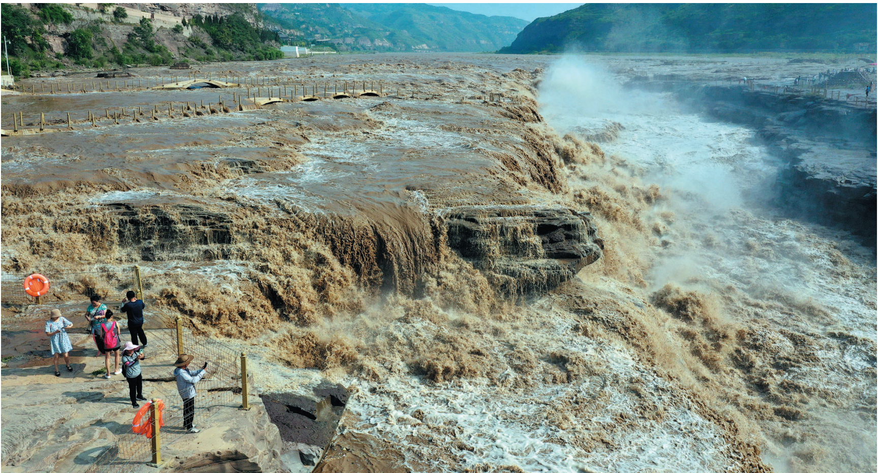
受近期上游降雨增多和万家寨水库调节放水影响,黄河干流进入主汛期,位于晋陕两省交界的黄河壶口瀑布水量大增。游客在黄河壶口瀑布景区观瀑。

铁西区将进一步提高政治站位,强化担当意识、求真务实,以高度的责任心和使命感,持续深入推进全面依法治市和法治政府建设,努力为全市经济社会高质量发展提供坚强法治保障,不断增强人民群众的获得感、幸福感、安全感。