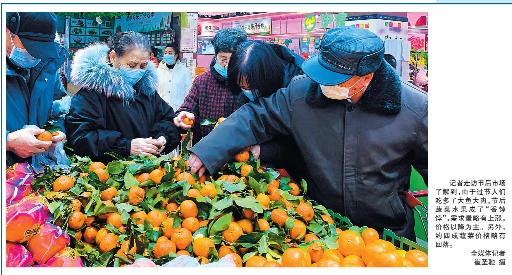
记者走访节后市场了解到，由于过节人们吃多了大鱼大肉，节后蔬菜水果成了“香饽饽”，需求略有上涨，价格以降为主。另外，约四成蔬菜价格略有回落。

公报还说，各成员承诺继续支持欠发达国家一同实现复苏。各成员代表重申对加强国际体系韧性的承诺，包括推动可持续性资本流动。各成员还承诺重视基础设施领域的投资，并鼓励资本介入。