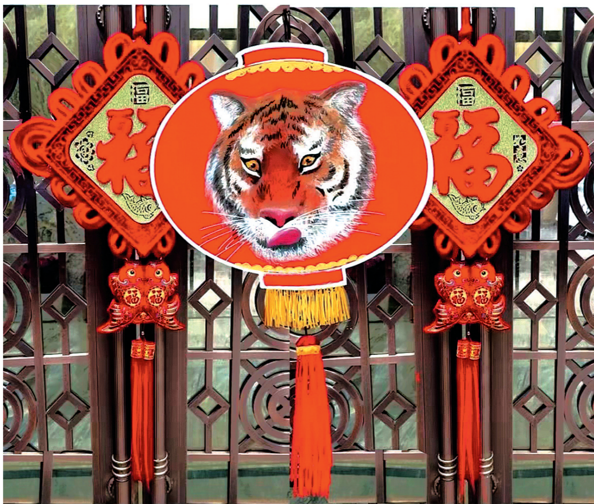
正月里 大红灯(漫画)