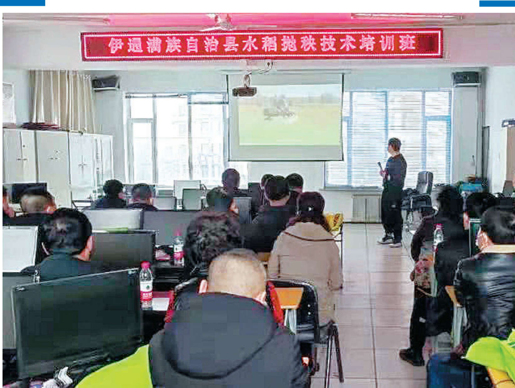
近日,伊通满族自治县农业农村局与中联重科厂家联合举办水稻有序抛秧技术培训班,重点培训抛秧技术和抛秧机操作技术,全县水稻种植大户40余人参加了培训。

本次活动也得到了双辽市包保部门、包保责任人的积极响应。全镇共走访慰问脱贫户200余户,发放慰问物资折合人民币近3万元。此次慰问活动让脱贫户群众感受到了浓浓的情意,他们纷纷表示,要牢记党和政府的关怀,在当地党委、政府的带领下努力奋斗,为助力乡村振兴贡献自己的一份力量。