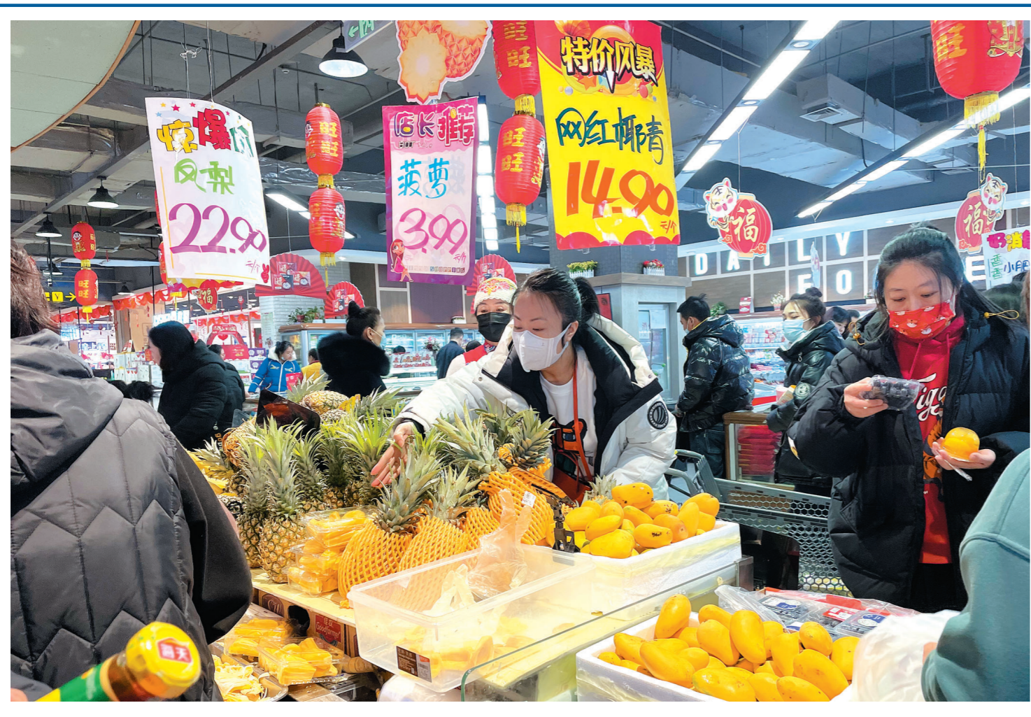
春季,市民的“果盘”变得丰富起来,冬季的苹果、梨子、脐橙等已经成为“过季”水果,芒果、菠萝等新鲜时令水果成为“新宠”,吸引了不少市民前来购买。这是铁东区一家超市,市民正在选购菠萝。

浙江省自贸办相关负责人介绍,今年以来,浙江落地国际高标准经贸规则取得实效。RCEP生效首月,自贸试验区所在地均成