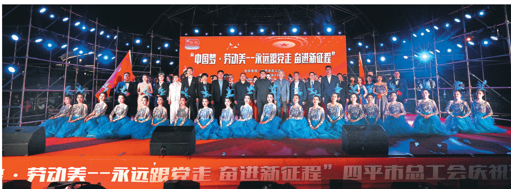
四平市总工会主办,吉林银行四平分行工会协办的“中国梦·劳动美——永远跟党走 奋进新征程”文艺展演活动现场。

吉林银行四平分行坚持立足本土,回归本源、服务地方经济、承担社会责任、服务实体、服务居民的市场定位,努力成为小微企业的贴心银行、成长型企业的伙伴银行、大型企业的敏捷银行、地方政府的增信银行。重点支持粮食深加工、装备制造、制造业等支柱产业,推动四平地区经济发展;加大对重点项目、重点企业的资金支持力度,主动为我市重点企业提供金融服