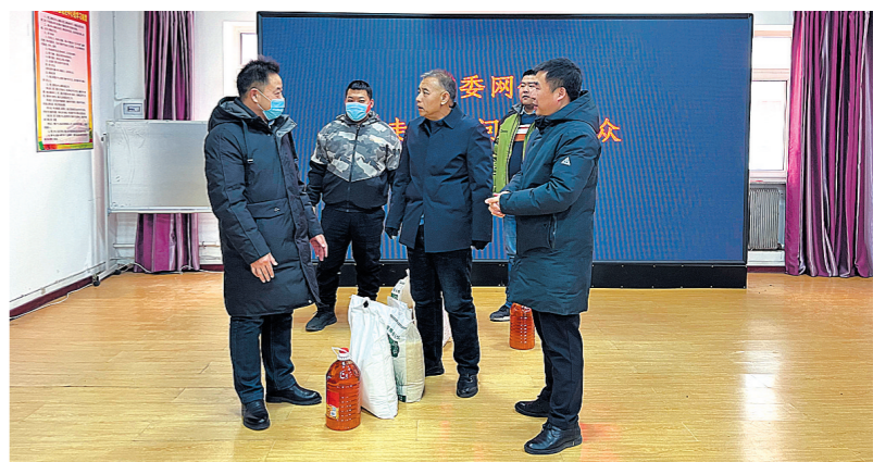
困难党员、困难退役军人、孤寡老人及患病困难群众一直是四平市委网信办关注的重点,日前,四平市委网信办领导带队来到双百共建活动包保的西铁区站前社区,为困难党员群众送去生活必需品,受助群众深受感动。