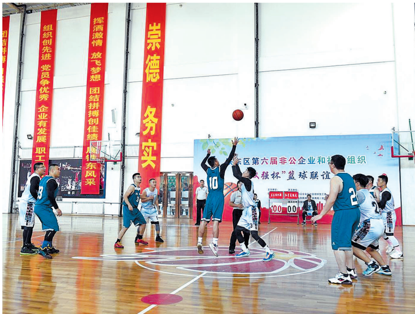
近日,铁东区举办第六届非公企业和社会组织“双强杯”篮球联谊赛。铁东区组织部 骆岩 摄