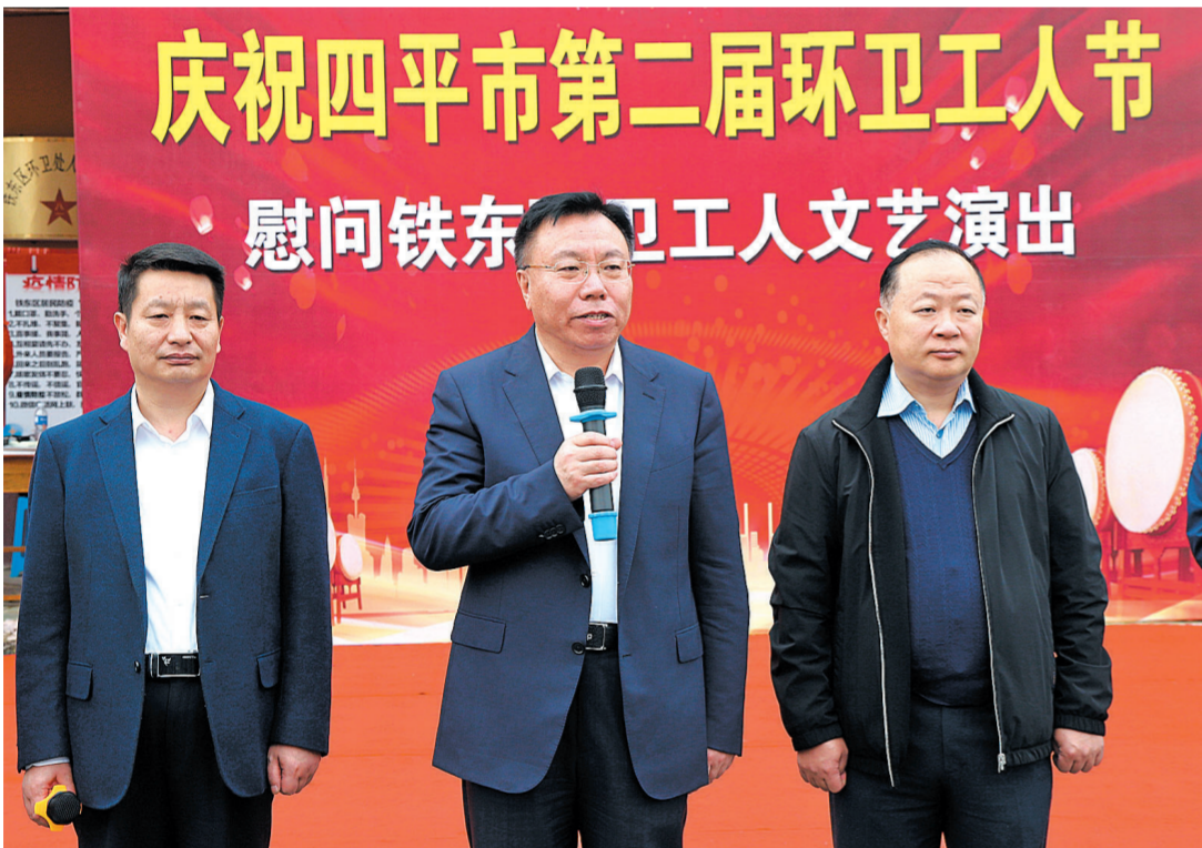
今年的10月26日是我市第二个环卫工人节。市委书记郭灵计带领市直相关部门负责同志，看望慰问了我市环卫工人，为他们送去关怀和问候。