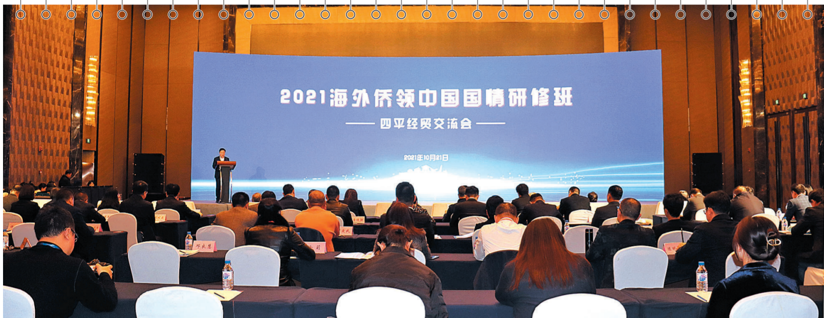
“2021海外侨领中国国情研修班——四平经贸交流会”会场。