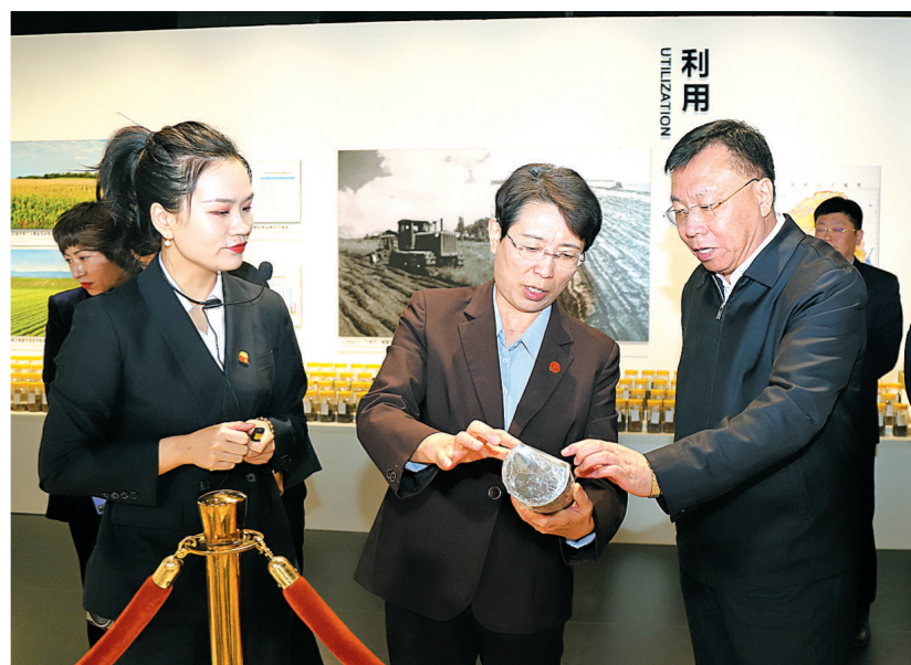
中国侨联党组成员、副主席隋军在市委书记郭灵计陪同下，到梨树黑土地博物馆调研。