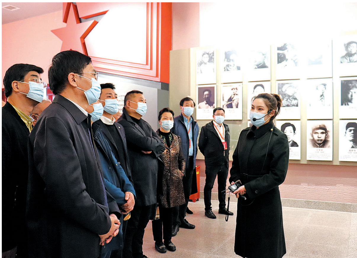
参观四平战役纪念馆。