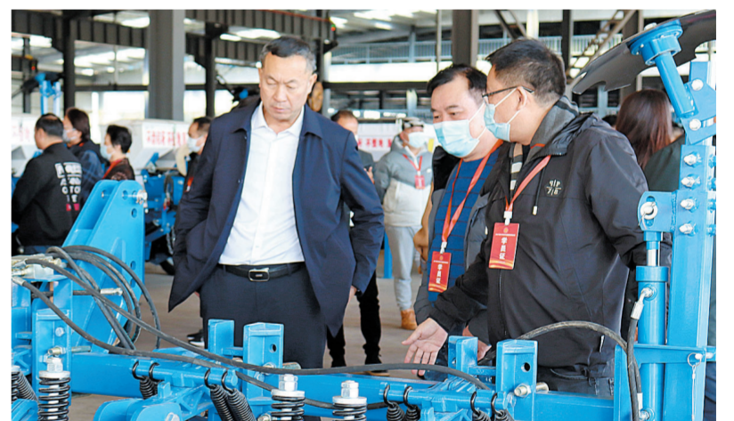
参观康达农业机械有限公司。