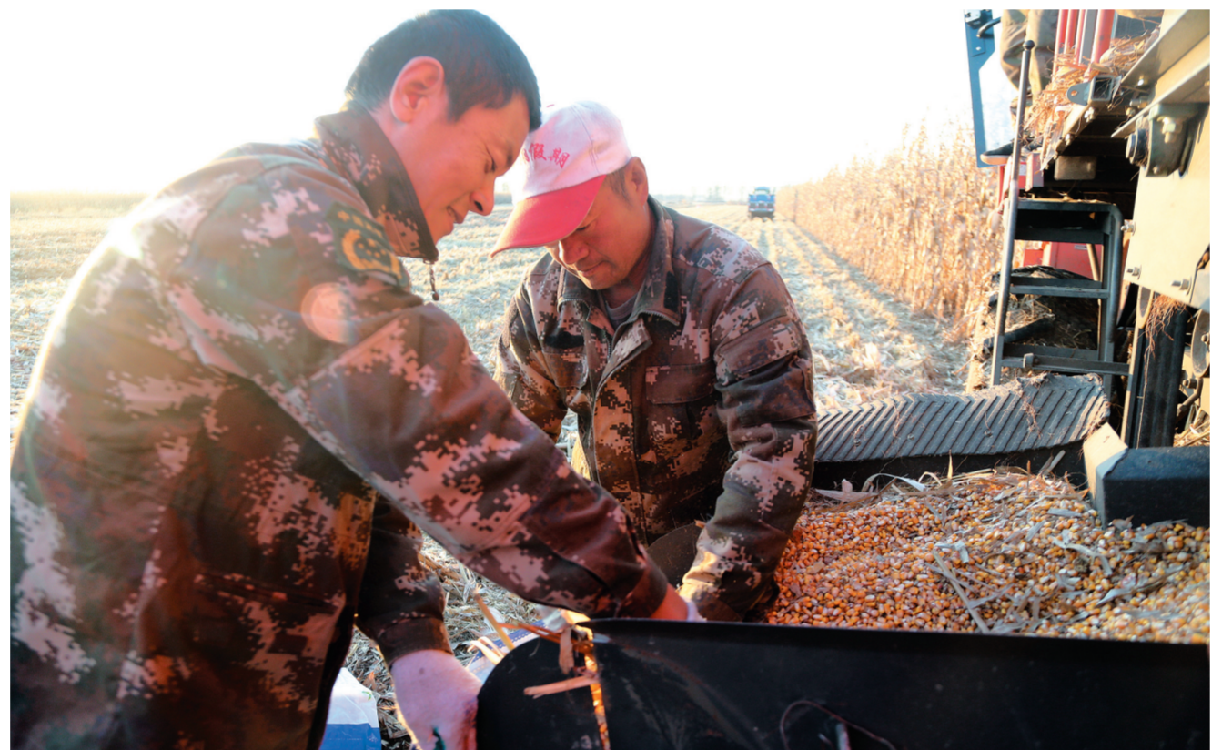
连日来,梨树县双河乡迎来了玉米丰收季,大型联合收割机在田间往来穿梭收割玉米,农民利用晴好天气抢收晾晒,确保颗粒归仓。本报记者 崔圣驰 摄

2021海外侨领中国国情研修班学员,市直相关部门负责同志,各县(市)区相关负责同志和部分企业家代表参加会议。