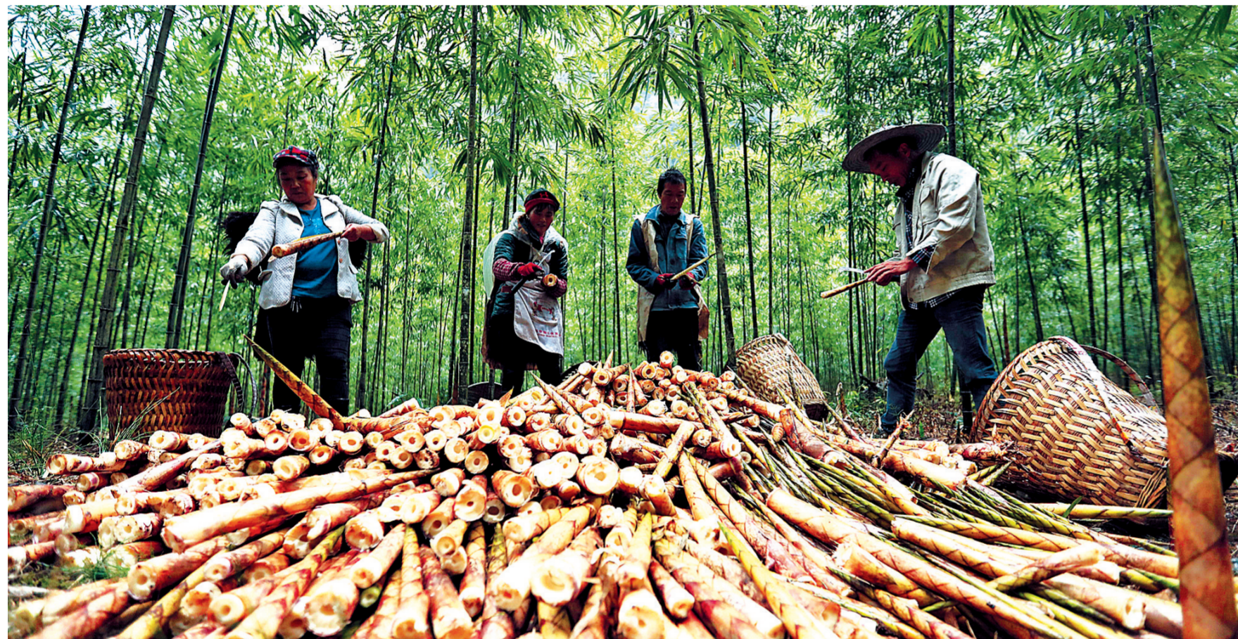
金秋时节，贵州省赤水市5万余亩大竹笋迎来采收季。10月10日，在贵州赤水市资源乡联华村，竹农将新鲜大竹笋去壳。