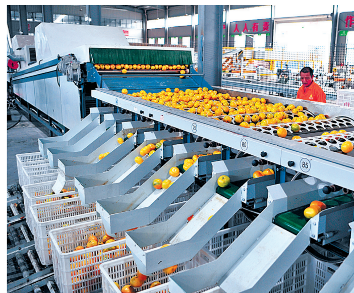
金秋时节，湖北省宜昌市夷陵区的农业企业和农产品专业合作社忙着采收分装柑橘，以满足国内外柑橘市场订单的需求。宜昌市夷陵区夷陵红生态农业开发有限公司工人在柑橘自动化筛选车间对橘子进行分级、包装、封箱。

商务部服贸司相关负责人说，接下来，商务部将制定年度工作计划，明确任务分工，确保政策落地见效。同时，将及时总结推广家政兴农的成功经验和典型案例。