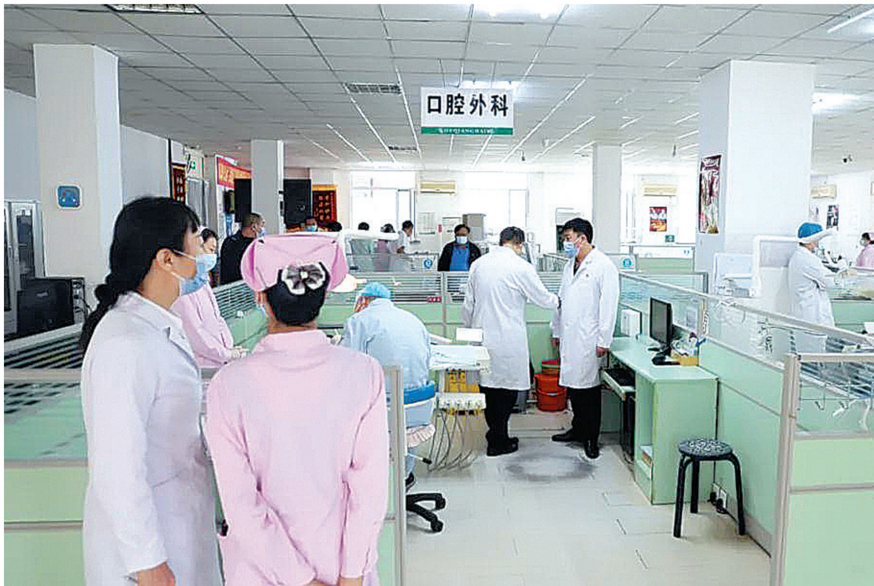
为确保全院职工及患者朋友度过一个安全祥和的节日,保证医院各项工作平稳运行,日前,四平市口腔医院开展国庆节安全大检查。由医院领导班子成员及相关科室负责人对全院各科室,特别是重点科室、重点部门安全情况进行大检查,对可能存在的安全隐患进行现场预判。

奶酪对于有些人还是有点陌生,我们可以将它认为是一种浓缩的牛奶,营养价值很高,但是市面上常见的奶酪产品往往含钠比较多,购买的时候建议看一下配料表以及营养成分表,选择相对来说蛋白质多而钠比较少的奶酪。(北青)